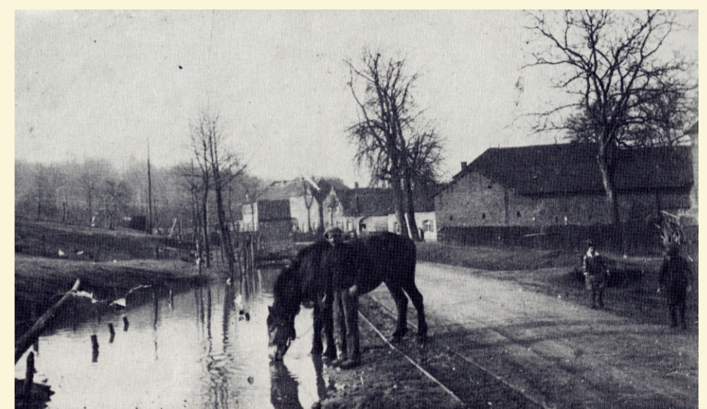
An der Viehtränke