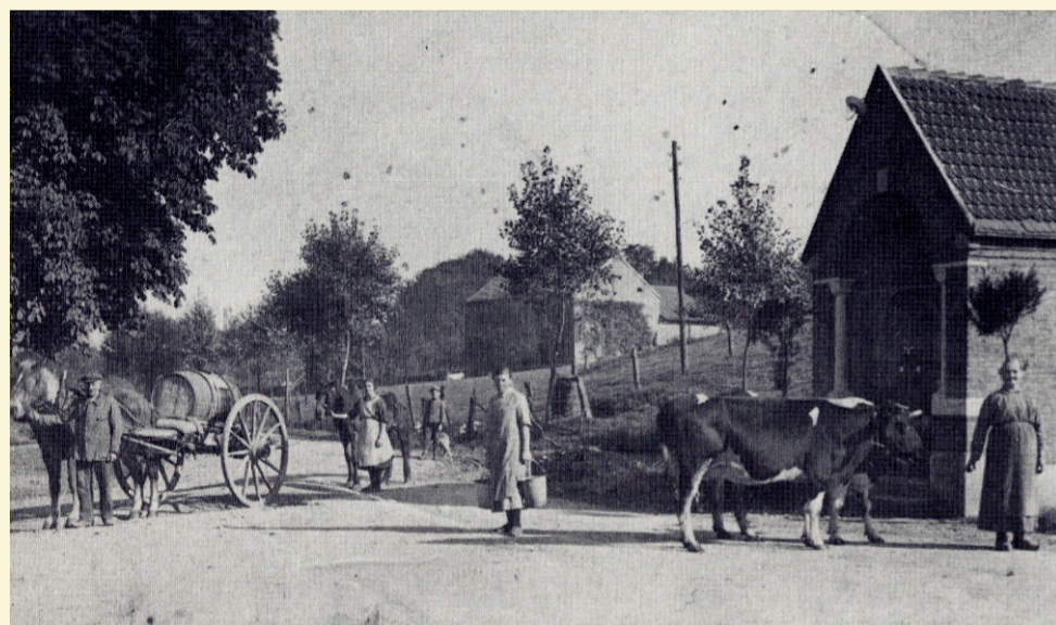
An der Quelle beim Kapellchen