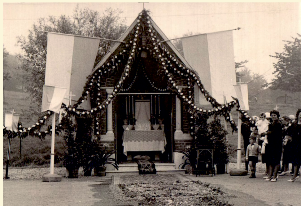
Zu Fronleichnam an der alten Kapelle