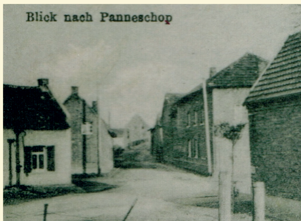
Blick nach Panneschop