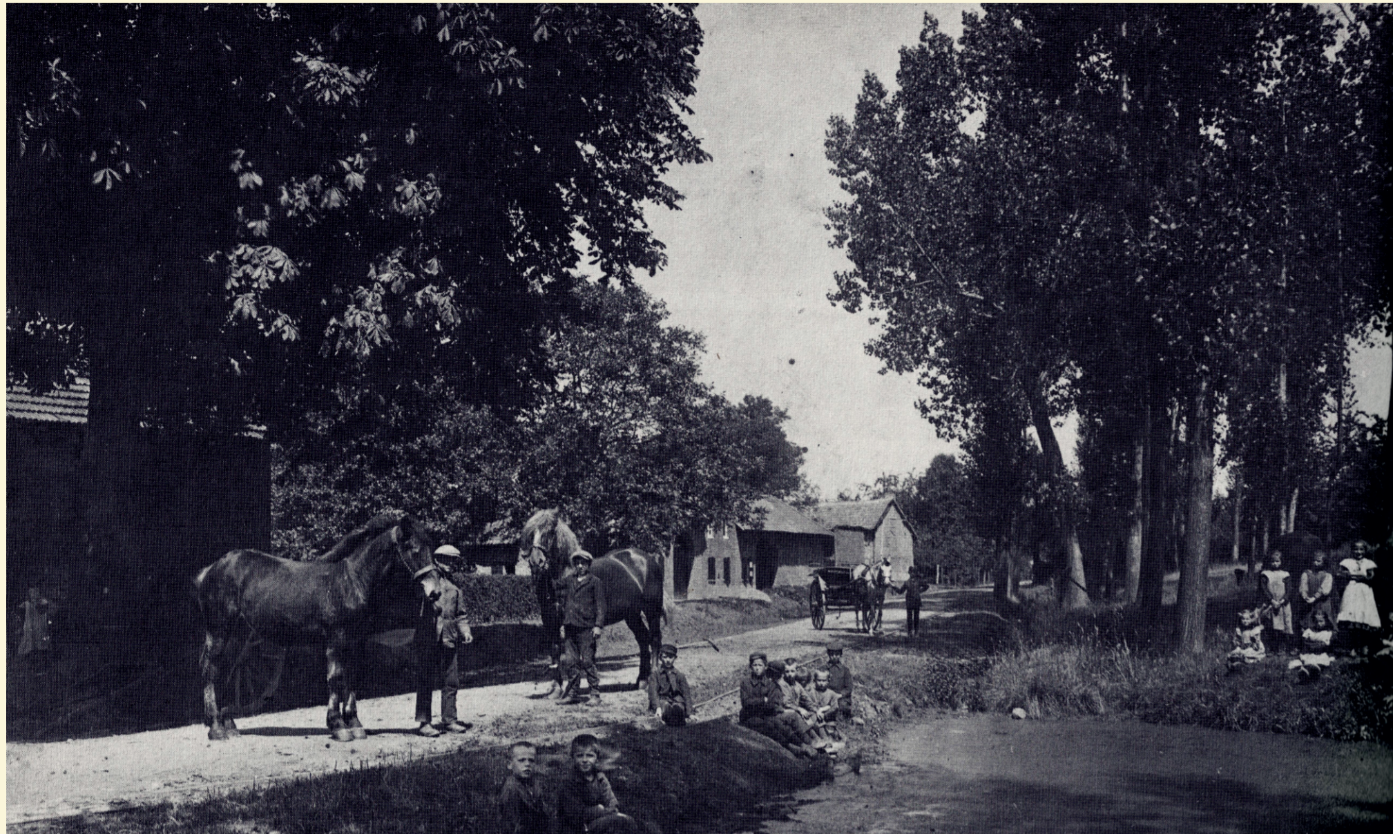
Idylle am Dorfweiher