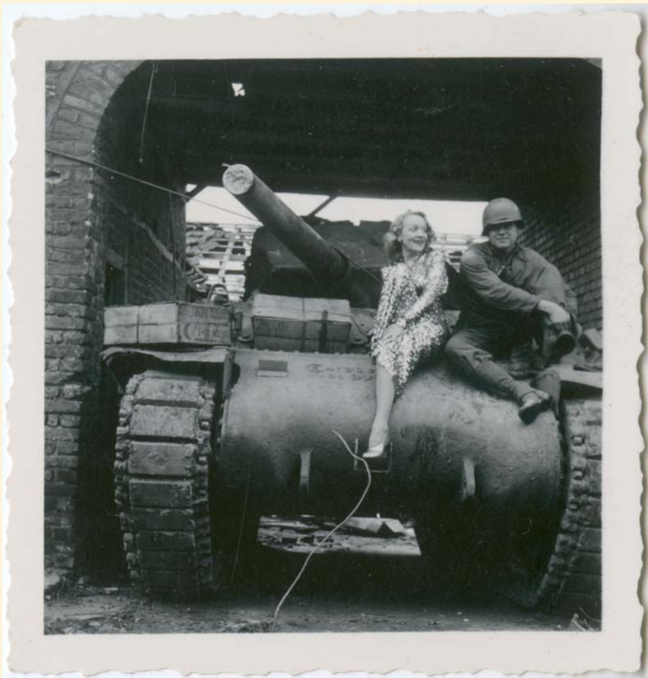
Bilder oben und unten: In der Hofeinfahrt des ehemaligen Bauernhofes Plum