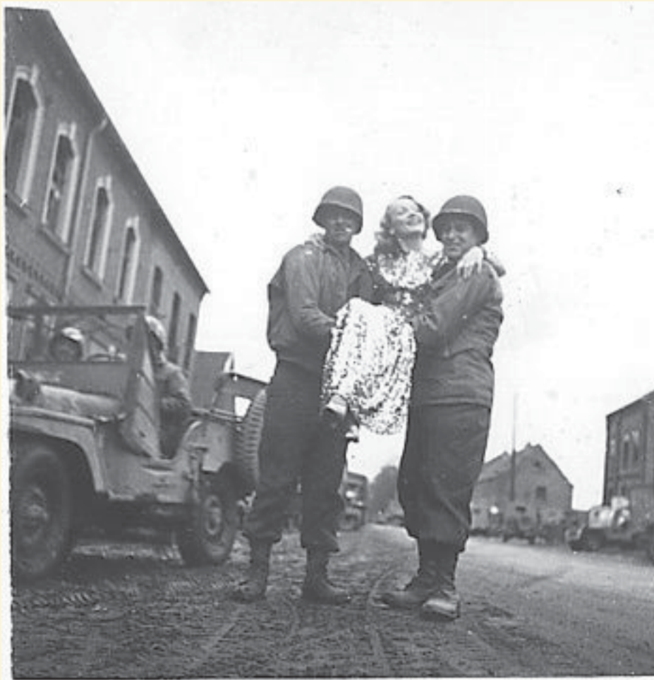
Vor den Häusern der ehemaligen Gaststätte Franzen und dem Blumenhaus Katja