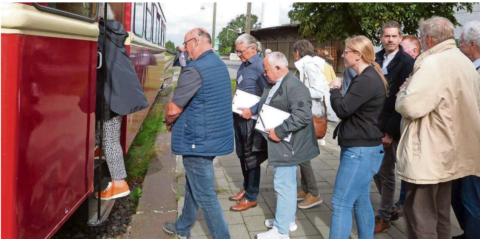
Besichtigt man Gillrath, gehört eine Fahrt mit der Selkantbahn immer dazu.