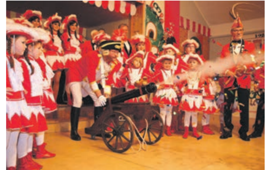
Karneval in Immendorf

Nirm 197 Einwohner Der Ortsname „Nirm“ ist wahrscheinlich aus „Nirheim“, dann „Niederheim“ entstanden, als Gegensatz zu „Opheim“, einer Gutsanlage freier Franken, die das Gelände gerodet haben. Der Ort zieht sich an einer schmalen Erosionsrinne zur Wurm hin. Vor Nirm liegt die Schlossruine „Leerodt“, eine ehemalige Wasseranlage aus dem 17. Jhrd. Das prachtvolle Herrenhaus wurde 1945 fast vollständig zerstört. Erhalten und