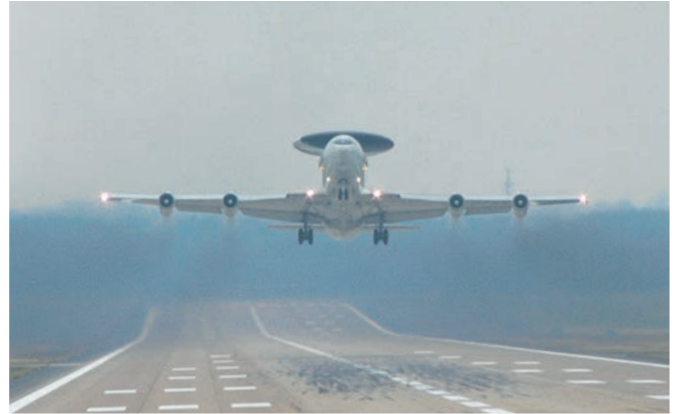
Awacs im Landeanflug auf die Nato Airbase Teveren

Bocket 22 Einwohner Bocket ist wie Panneschopp eines der kleinsten Dörfer im Stadtgebiet Geilenkirchen. Mit Pan-