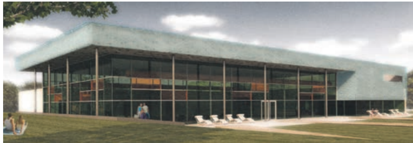
Planungsansicht des neuen Hallenbads

Am 02.04.2013 hat sich die Sportstättenlandschaft der Stadt Geilenkirchen schlagartig verändert. Durch einen Großbrand im Sportzentrum Bauchem wurden das Hallenbad, die angrenzende Saunaaanlage sowie das Hallenbadrestaurant vollständig zerstört. Die angrenzende Dreifachturnhalle konnte durch den vorbildlichen Einsatz der Feuerwehr vor den Flammen gerettet werden. Dennoch hatte die Halle schwere Schäden davon getragen. Bereits unmittelbar nach dem Brandereignis stand für Politik und Verwaltung der Stadt fest, dass die Turnhalle saniert und ein neues Hallenbad errichtet werden müssen. Die Turnhalle konnte bereits im September 2015 wieder in Betrieb genommen werden. Nach umfangreichen Planungen wurde im September 2015 mit dem Neubau des Hallenbades begonnen.