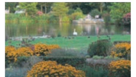
Herbstidylle im Wurmauenpark