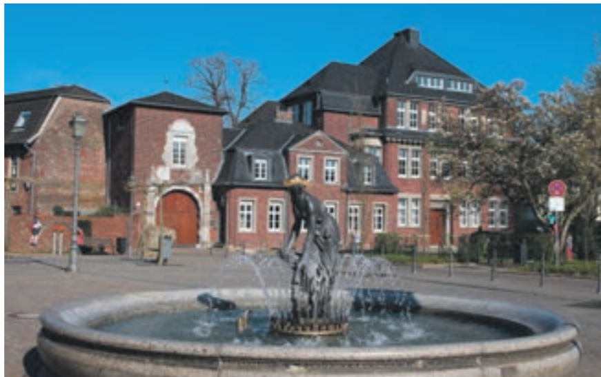
Gymnasium St. Ursula

Das Angebot der städtischen weiterführenden Schulen umfasst die städt. Realschule Geilenkirchen mit offenem Ganztagsangebot sowie die Anita-Lichtenstein-Gesamtschule als Ganztagschule. Den Schülerinnen und Schülern stehen in den Sekundarstufen I und II somit folgende Bildungsabschlüsse offen: Hauptschulabschluss, Hauptschulabschluss nach Klasse 10, Fachoberschulreife, Fachhochschulreife und Abitur. Schülerinnen und Schülern mit dem Förderschwerpunkt Lernen, Sprache, soziale und emotionale Entwicklung bietet die Mercator/Don-Bosco-Schule in Gangel und Heinsberg-Oberbruch in Träger-