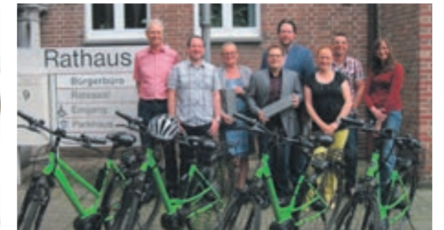
Mit dem E-Bike zur Arbeit

und somit auch der Treibhausgasemissionen. Die Maßnahmen dieses Teilkonzeptes beziehen sich aber speziell auf die Gebäude, die sich im Eigentum der Stadt Geilenkirchen befinden. Somit dient das Klimaschutz-Teilkonzept vor allem dazu, zukünftig die CO 2 -Emissionen und die Energiekosten städtischer Einrichtungen zu reduzieren. Die Erstellung der Klimaschutzkonzepte wurde gefördert durch die Bundesrepublik Deutschland.