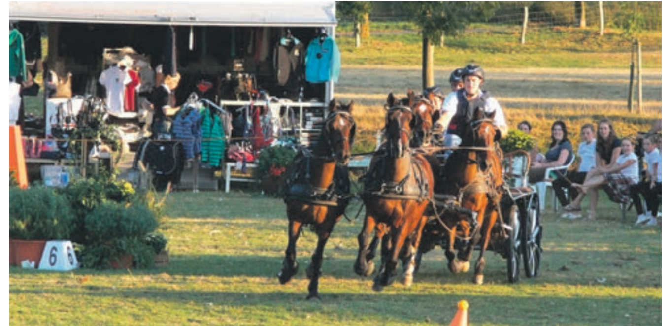
Reitturnier an Trips