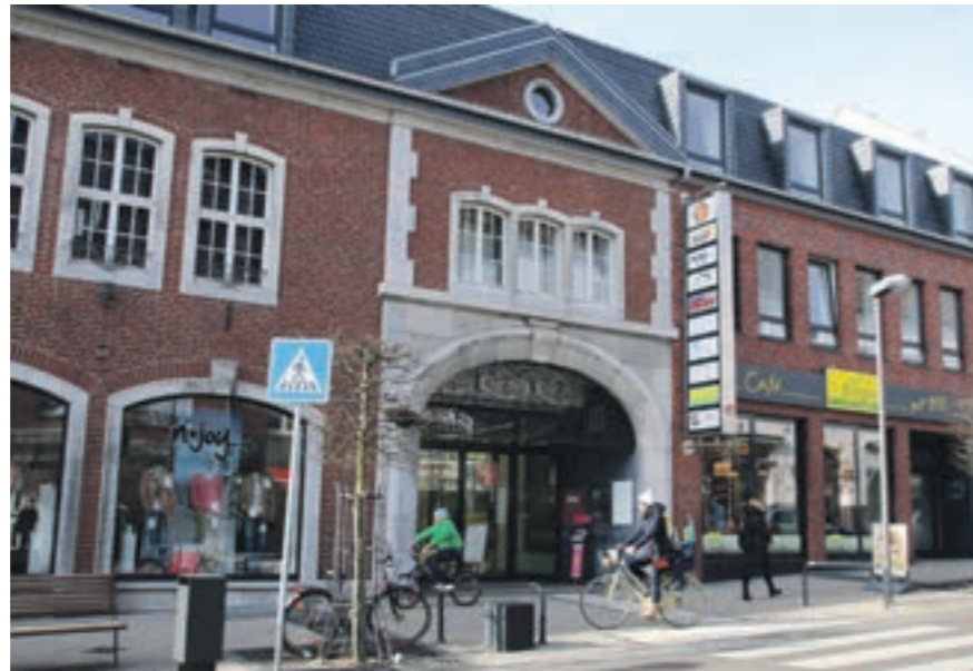
Neugestaltete Front der Galerie K

Weiterhin verfügt Geilenkirchen direkt in der Innenstadt über das Einkaufszentrum „Gelo Carré“ sowie die angrenzende „Galerie K“. Über einen fußläufigen Rundgang erreicht man hier zahlreiche Einzelhandelsgeschäfte. Neben einem großen Lebensmittelfachmarkt haben