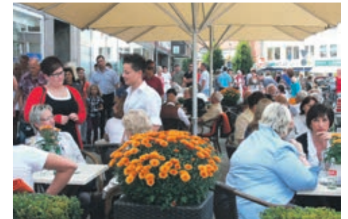
Verkaufsoffener Sonntag in Geilenkirchen

In Geilenkirchen haben sich zahlreiche Wirtschaftsunternehmen angesiedelt, die sich zum Teil auf nationaler als auf internationaler Ebene bewegen. Zu den größten Arbeitgebern in unserer Stadt mit einer Mitarbeiterzahl von über 250 Personen zählen beispielsweise die Firmen CSB System AG, KSK Industrielackierungen, das