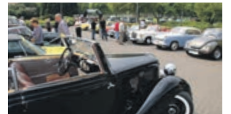
Oldtimertreff an Loherhof

Wenn Sie mehr über Vereine und Freizeitangebote in Geilenkirchen wissen möchten, besuchen Sie unsere Homepage unter www.geilenkirchen.de .