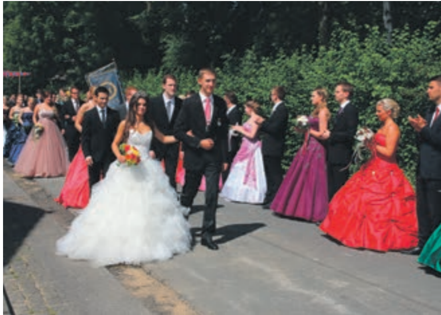
Maikirmes in Beeck

ck, der 1166 im Besitz der Herren von Randerode (Randerath) war. Der Name leitet sich ab von der Lage am Bach, das heutige Beekfließ. Heute ist Beeck bereits mehrfacher Preisträger des Wettbewerbs „Unser Dorf soll schöner werden“ und hat auf Bundesebene 1995 die Silbermedaille gewonnen. Im Landeswettbewerb hat Beeck bereits zweimal Gold geholt. Neben 12 landwirtschaftlichen Betrieben gibt es noch verschiedene andere Gewerbe, u. a. ein Heuhotel, ein Bauern- und Erzählcafé und Hofläden. Im Jahresverlauf stehen viele Feste an, deren Organisation und Durchführung die ortsansässigen Vereine übernehmen. Über die Dorfgränze weit hinaus bekannt ist das alljährliche Backesfest, bei dem Brot, Fladen, Pizza u.v.m. angeboten werden. Außerdem existiert in Beeck seit einigen Jahren eine Theatergruppe, die jedes Jahr