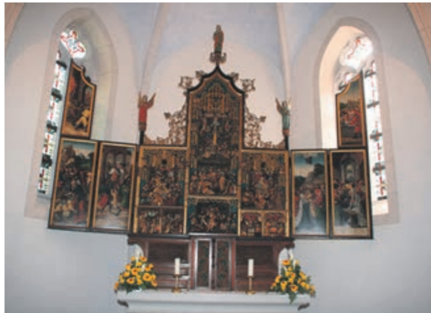
Flandrischer Schnitzaltar in der Kirche Süggerath

Süggerath entstand als Rodesiedlung im Prummerner Hofverband als ein Straßendorf. Die Herren von Horrich waren bis zum 18. Jh. auch die Herren von Süggerath. Bis zum Beginn der Industrialisierung war neben der Landwirtschaft die Holzverarbeitung (Holzschuhe, Korbmacherei) Einnahmequelle der Süggerather Bevölkerung. Nach Beginn der Industrialisierung lag Süggerath an der Eisenbahnverbindung Aachen-Düsseldorf. Dadurch entstanden auch hier neue Arbeitsplätze. Durch die Ansiedlung des Randerather Stahlbaubetriebs Fabry in Süggerath wurden auch wieder Arbeitsplätze geschaffen. Süggerath hat sich im Laufe der Jahre bis heute immer mehr zu einem Wohndorf entwickelt. Die Bewohner arbeiten überwiegend außerhalb; die Kinder gehen in Geilenkirchen und Umgebung zum Kindergarten oder zur Schule. Die Süggerather leben aber ein reges