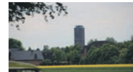
Wasserturm in Bauchem.

2.991 Einwohner Erstmals erwähnt als Baychem um 1300; ab 1790 wird Bauchem von Geilenkirchen mitverwaltet. Das Wahrzeichen des Stadtteils, der Wasserturm, wurde 1950 in Betrieb genommen, nachdem der erste Wasserturm, der 1903 entstand, im 2. Weltkrieg zerstört wurde. Heute dient der unter Denkmalschutz stehende Turm noch als Ausgleichsbehälter. Das 1933 fertig gestellte Freibad „Steinbuschbad“ war zu seiner Zeit einmalig und machte Bauchem im Umland bekannt. Daneben betrieb die Familie Stein-