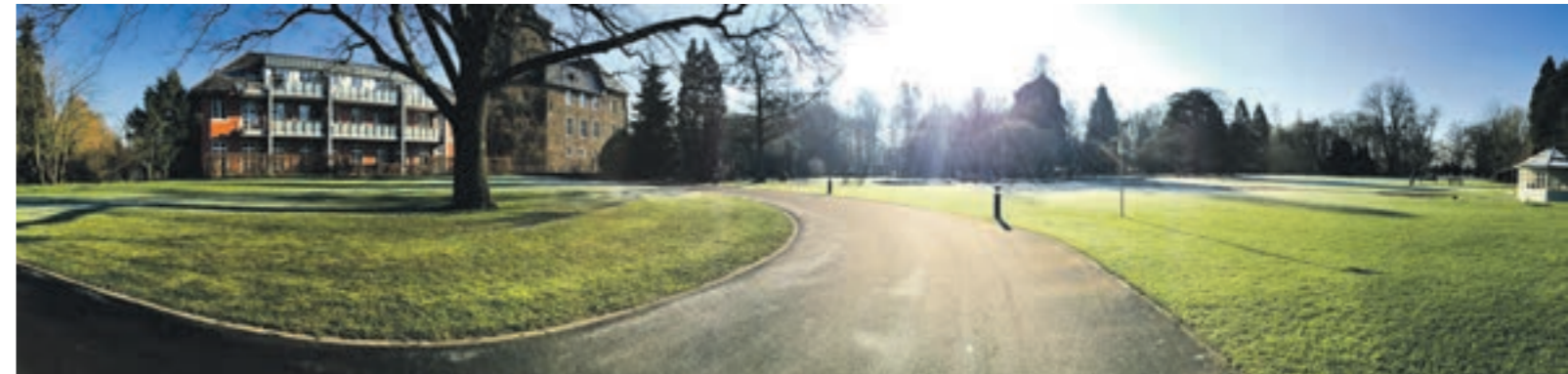
Park der Seniorenwohnanlage Burg Trips

Größte Ausdehnung: Nord-Süd: 9,5 km Ost-West: 15,4 km Gesamtfläche: 8319 ha Einwohnerzahl: 29.065 Bevölkerungsdichte: 349 je qkm