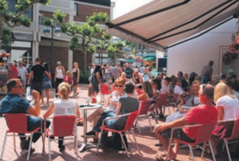
Entspannen in der Innenstadt