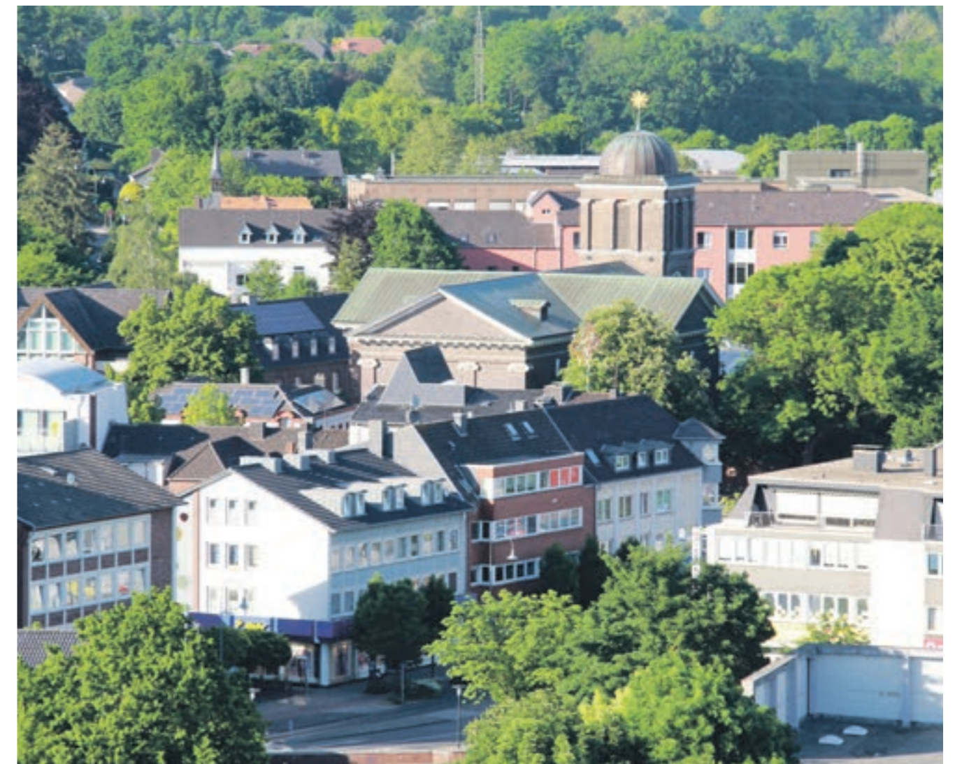
Die Innenstadt von Geilenkirchen