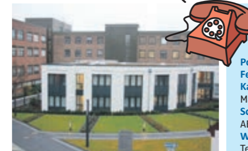
Modernste Medizin: Das St. Elisabeth Krankenhaus

Ambulante Hospizbewegung Camino e.V. , Martin-Heyden-Str. 32, Geilenkirchen, Tel.: 72763, Mobil: 0177 / 3118424 Jugendamt Notdienst (nach Dienstschluss) Tel.: 02131 / 511744 Frauenhaus des Kreises Heinsberg, Aufnahmebereitschaft 24 Stunden, Tel.: 02432 / 3887 Freiwilligenzentrum im Kreis Heinsberg, Hochstraße 24, 52525 Heinsberg, Tel. 02452 / 156790 oder 1567922