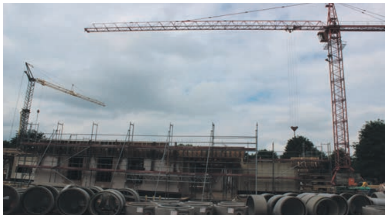
Baufortschritt im Juni 2016

Kurzum: Mit dem neuen Hallenbad erhält Geilenkirchen eine weitere Attraktion, mit der das breit gefächerte Sport- und Freizeitangebot der Stadt nochmals deutlich erhöht und sinnvoll ergänzt wird. Überzeugen Sie sich selbst. Schon jetzt ist der tägliche Baufortschritt deutlich erkennbar und lässt sich im Übrigen bequem von Zuhause aus über www.geilenkirchen.de per Webcam verfolgen. Spätestens ab Eröffnung im Frühjahr 2017 können Sie sich selbst von den Vorzügen des Bades überzeugen.