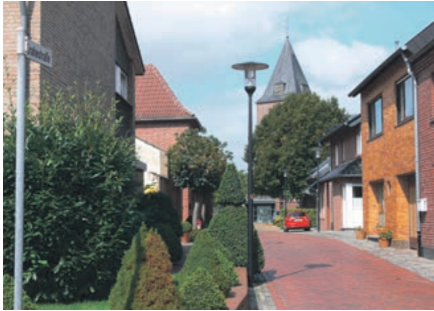
Krahestraße in Prummern