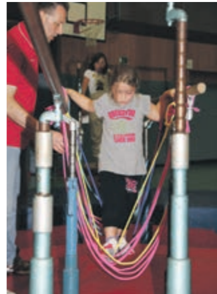
Auch die Kleinsten sind sportlich aktiv