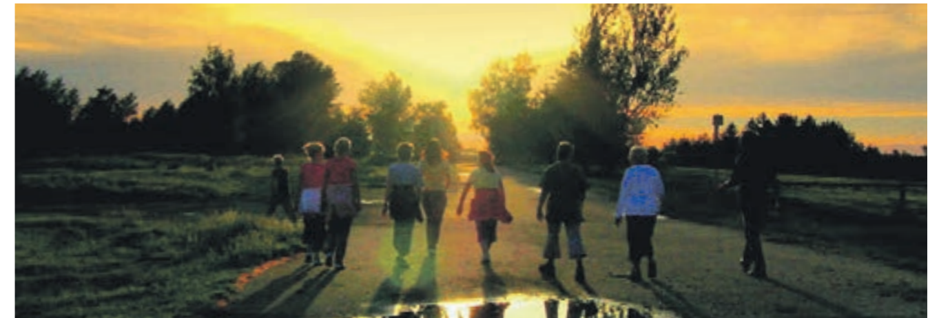
Walking in der Teverener Heide

Geilenkirchen bietet ein reges Vereinsleben und herrlichste Natur direkt vor der Haustüre.